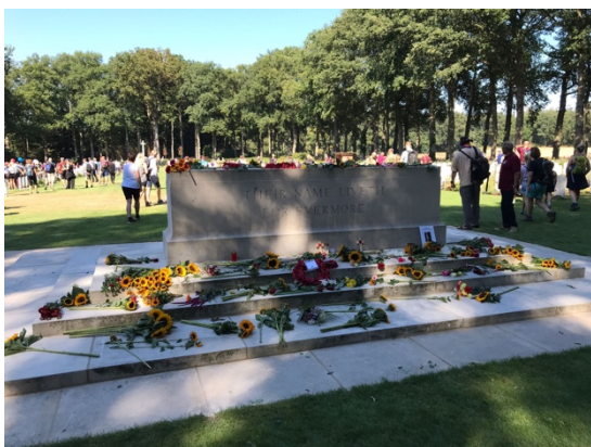
Fietstocht in Drie